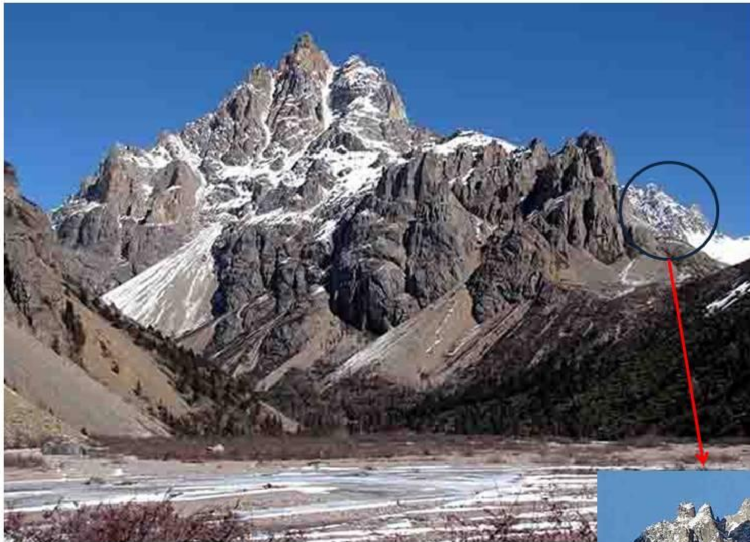
「メコン・玉曲分水嶺」 (加母同南・ Jiamutongnan 連峰) -5925m峰南面