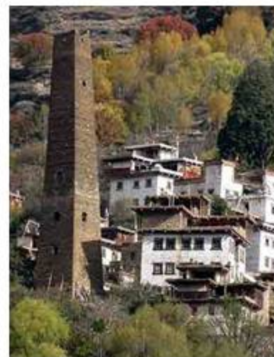
丹巴(Danba)の石石塔=石の塔