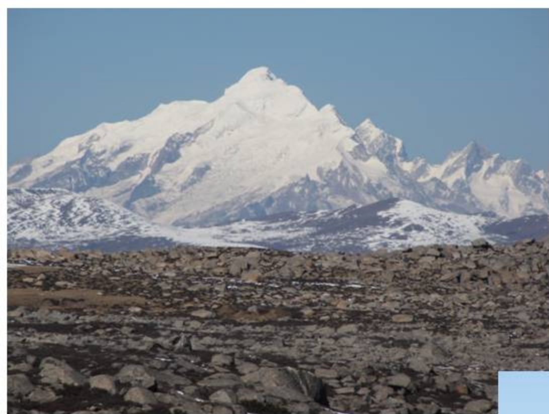
理塘高原 Genyen·東面 6204m