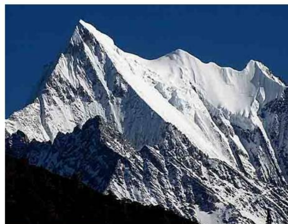
稻城 夏諾多季(Xiarudoji) 西面 5958m