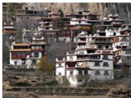
丹巴(Danba)の子ベトナム人集落