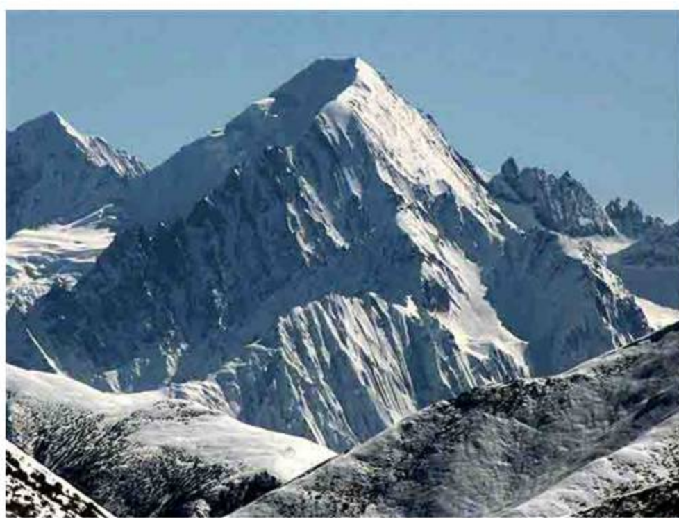
「怒江·玉曲分水嶺」·5841m峰北面