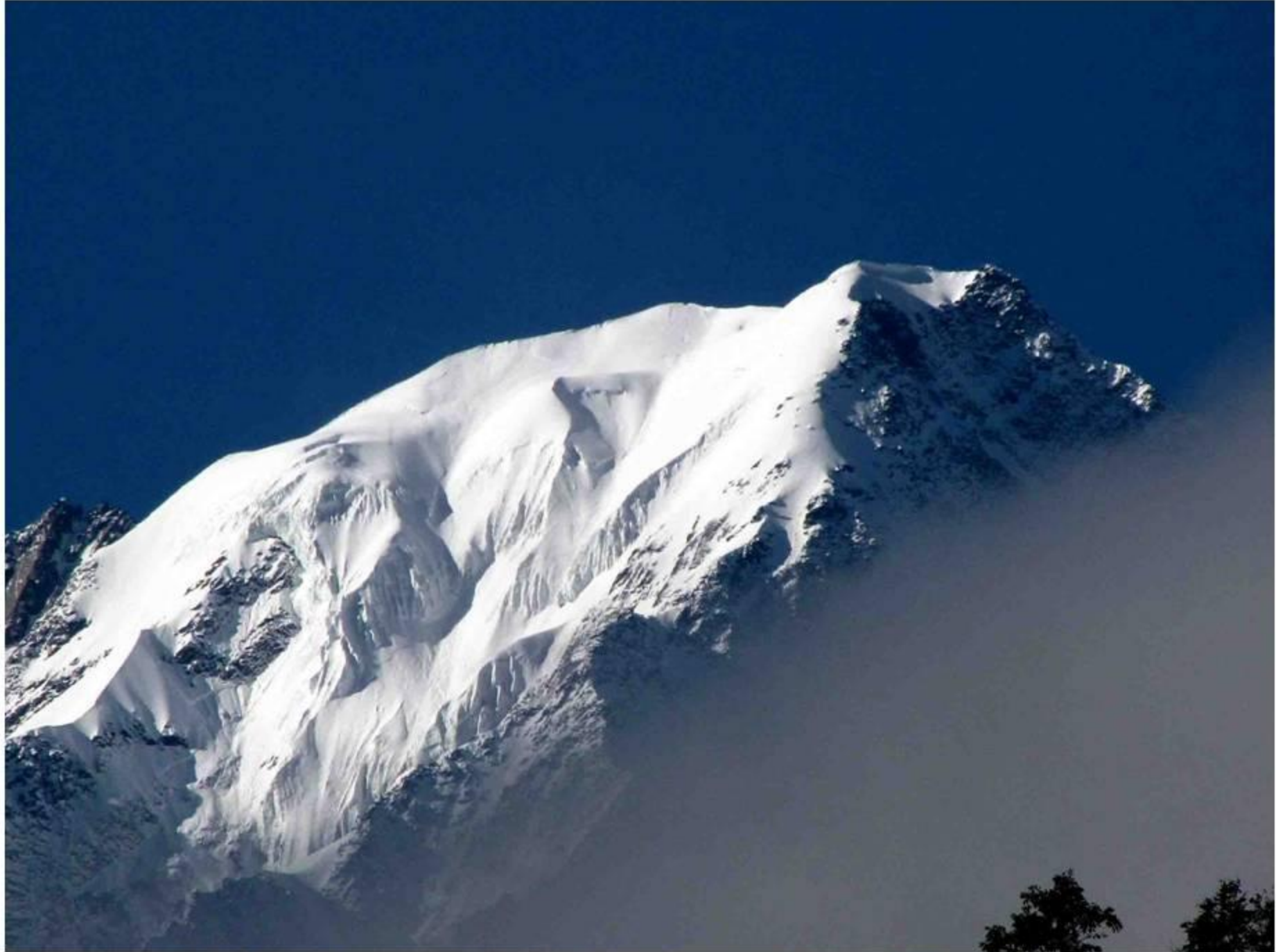
大雪山系南端 Ren Zhong Feng 南面-6079m 四日待った朝一瞬雲が切れた。