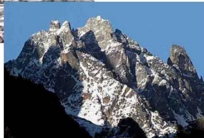
「メコン・玉曲分水嶺」(加母同南・ Jiamutongnan 連峰)-5800m峰南面