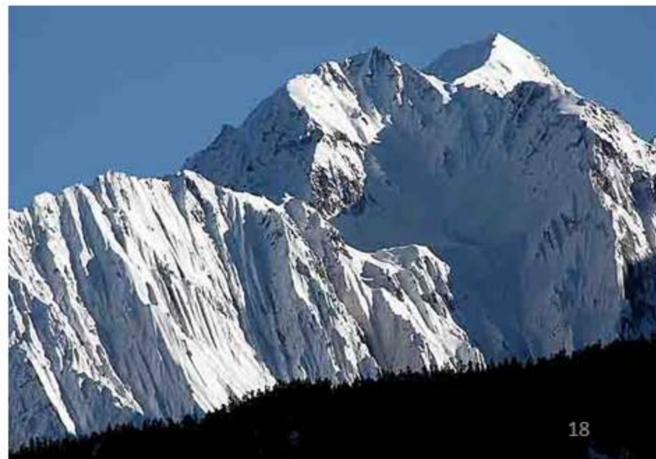
「怒江·玉曲分水嶺」·5700m峰北面