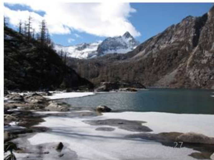
Hulu Hai 4170mより