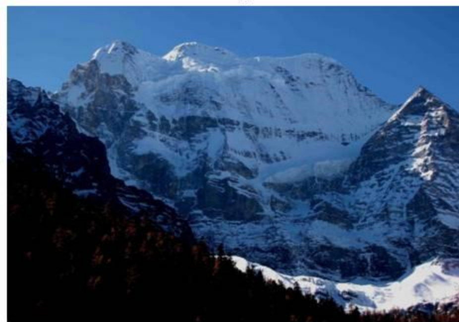
稻城 仙熱日(Xiannairi) 北面 6032 73 m