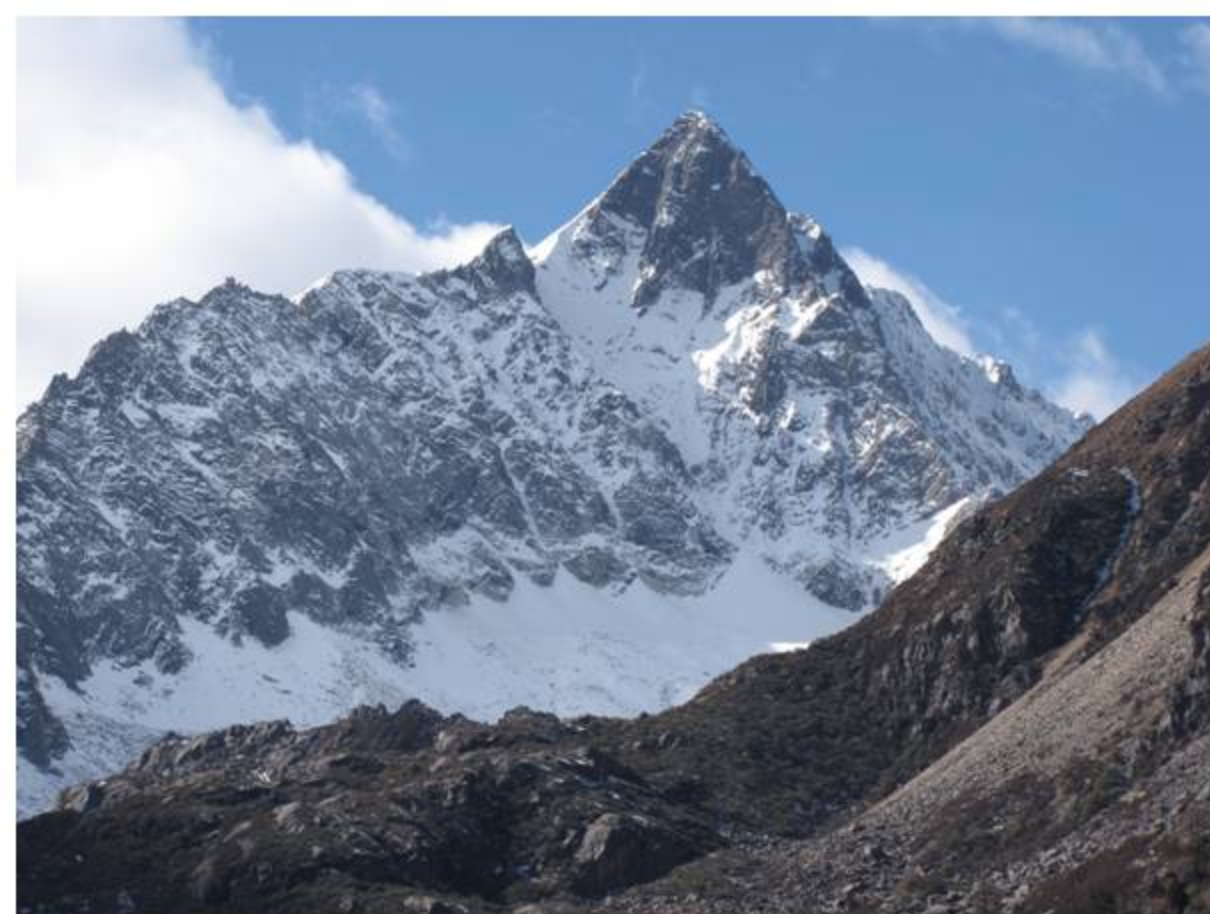
大雪山系北端 夏羌拉 (Xiaqingla) 東面・5470m