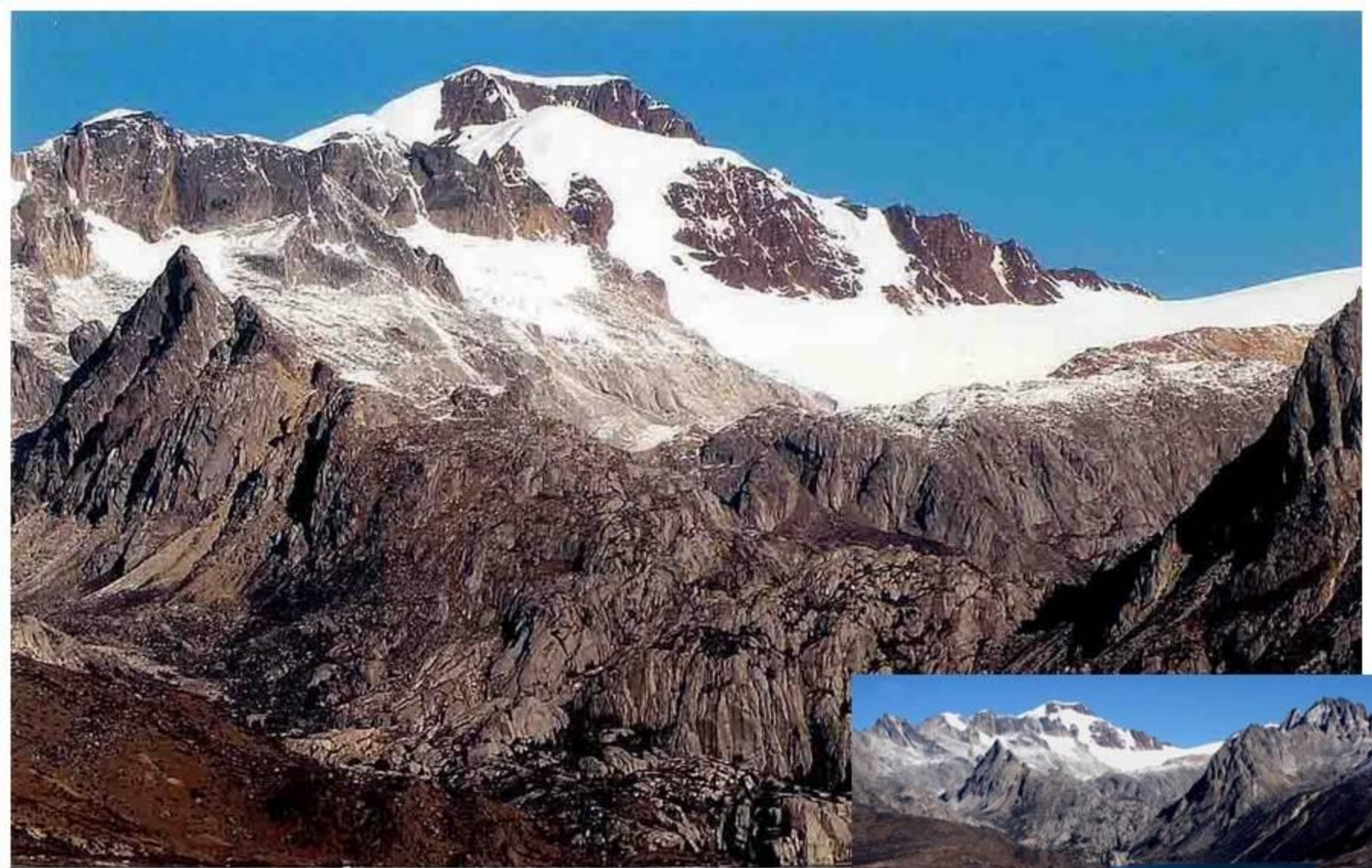
「沙魯里山系」(Shalufi Shan) 夏塞(Xiashe)南面-5833m。 南面にふたつの美しい氷河湖をもち、公路からも近い。数年前に ニュージーランドとカナダの女性クライマーが北面から初登頂した。