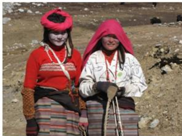
理塘高原の娘たち